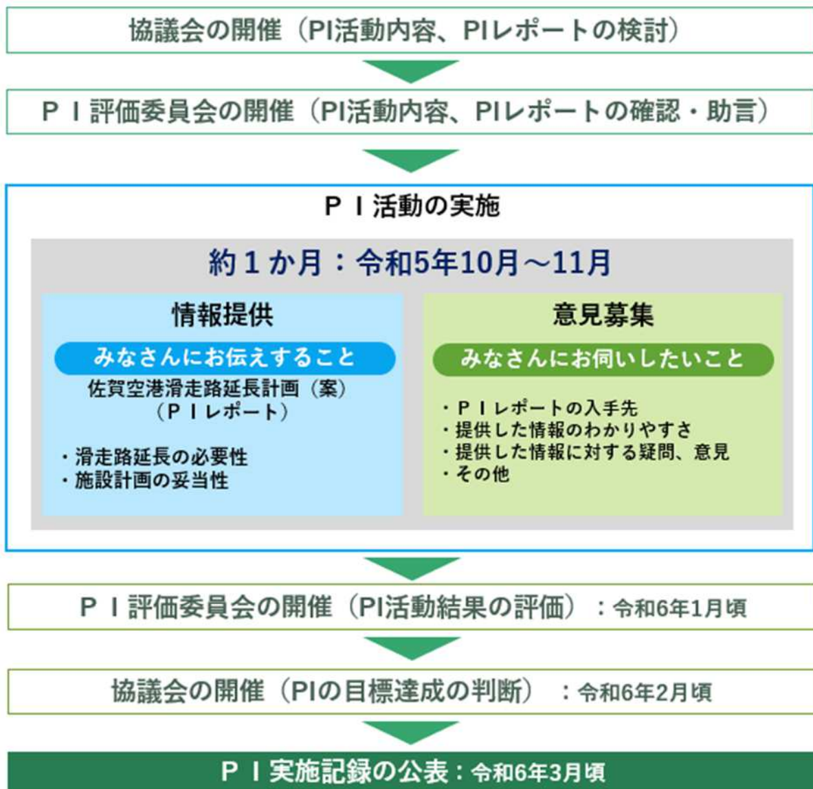
図 3.1 P I の流れ

P I 活動終了後、協議会は、P I 活動結果の総括を行います。また、P I の目的が達成できたか否かを判断する資料を作成し、P I 評価委員会に諮ります。P I 評価委員会での評価・助言に基づき、協議会は P I の目標達成を最終的に判断し P I を終了します。