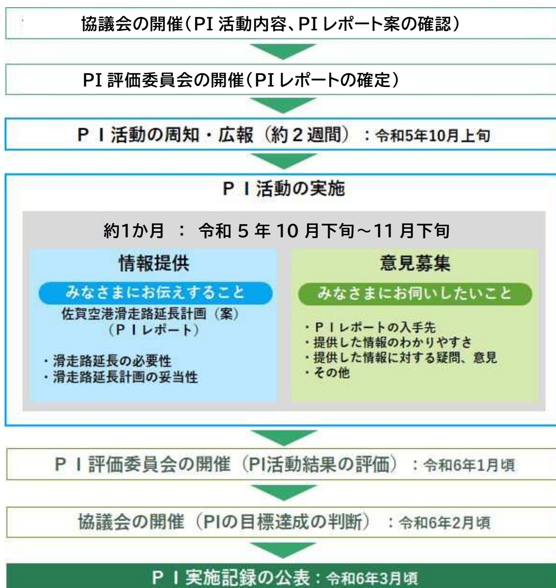
図 3.1 P I の流れ

P I 活動終了後、協議会は、P I 活動結果の総括を行います。また、P I の目的が達成できたか否かを判断する資料を作成し、P I 評価委員会に諮ります。そこでの評価助言に基づき、協議会は P I の目標達成を最終的に判断し P I を終了します。