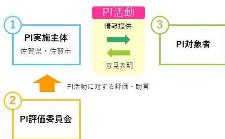
図 2.1 P I 活動に係る主体と役割

P I活動は、P I評価委員会による評価・助言を受けながら進めることで、P I活動の透明性、客観性を確保します。