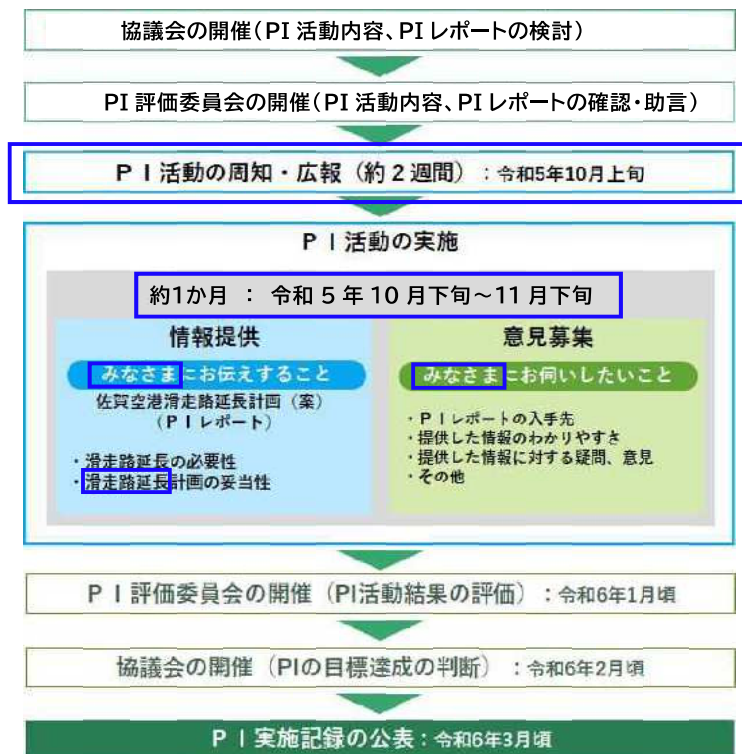
図 3.1 P I の流れ

P I 活動終了後、協議会は、P I 活動結果の総括を行います。また、P I の目的が達成できたか否かを判断する資料を作成し、P I 評価委員会に諮ります。そこでの評価助言に基づき、協議会は P I の目標達成を最終的に判断し P I を終了します。