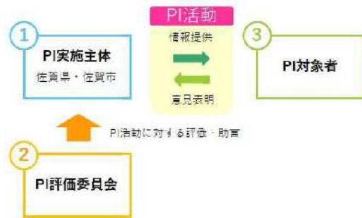
図 2.1 P I 活動に係る主体と役割

P I 活動は、P I 評価委員会による評価・助言を受けながら進めることで、P I 活動の透明性、客観性を確保します。