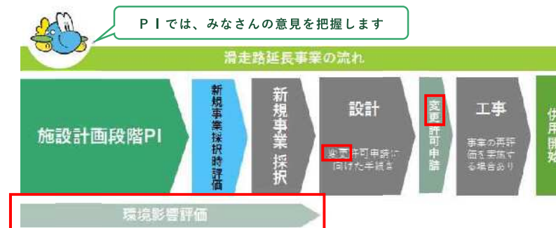
図 1.1 施設計画段階PIと空港整備の流れ

このPIは、滑走路延長の必要性と施設計画の妥当性に関して、みなさんからのご意見を把握するために実施するものです。