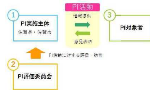
図 2.1 P I 活動に係る主体と役割

P I 活動は、P I 評価委員会による評価・助言を受けながら進めることで、滑走路延長計画の透明性、客観性を確保します。