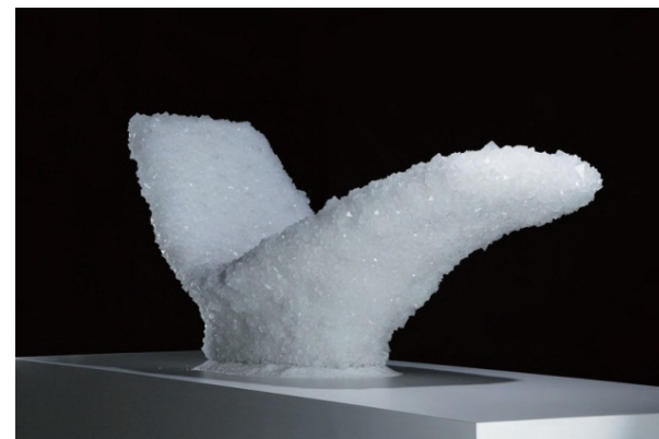
■ VENUS (アーム・チェア)