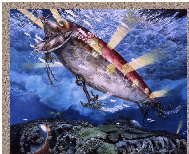
《Bait》2010 紙にペン、インク 22×27cm 撮影：宮島径 ©IKEDA Manabu Courtesy Mizuma Art Gallery