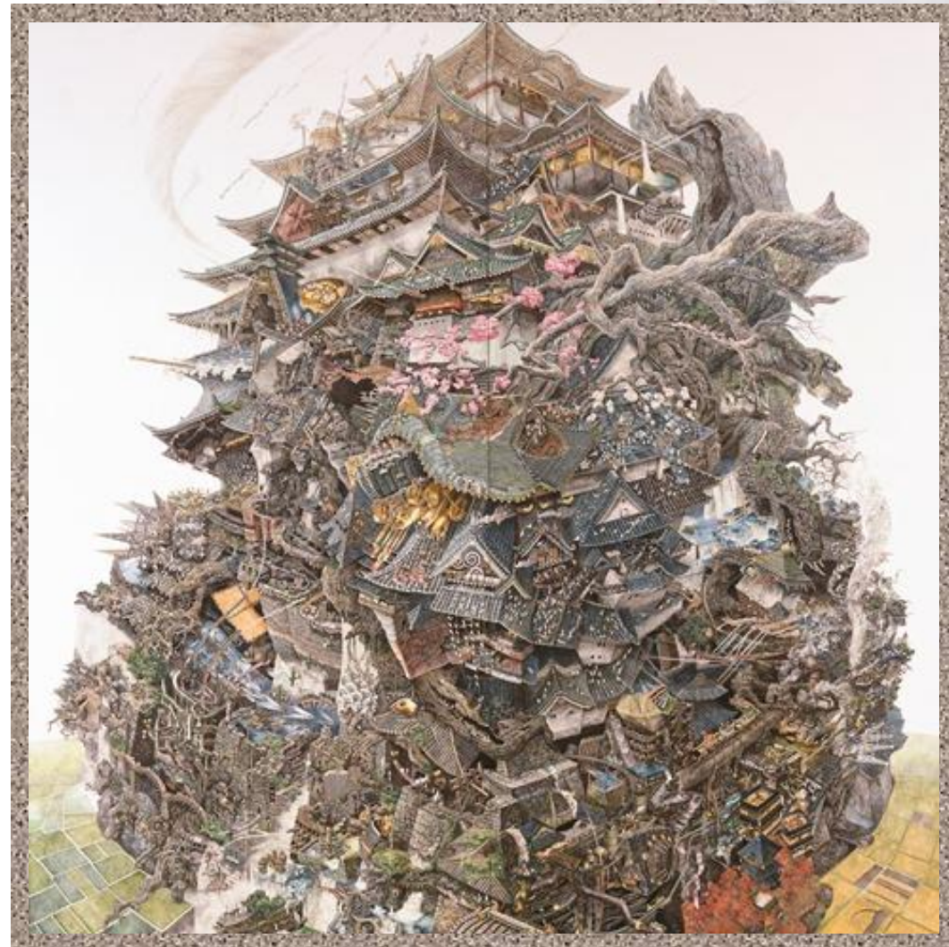
《興亡史》2006 紙にペン、インク 200×200cm 撮影：宮島径 高橋コレクション ©IKEDA Manabu Courtesy Mizuma Art Gallery