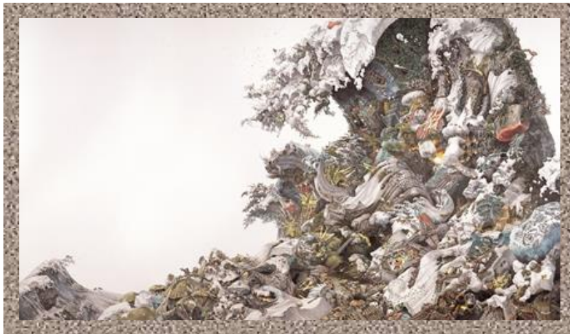
《予兆》2008 紙にペン、インク 190×340cm 株式会社サステイナブル・インベスター所蔵