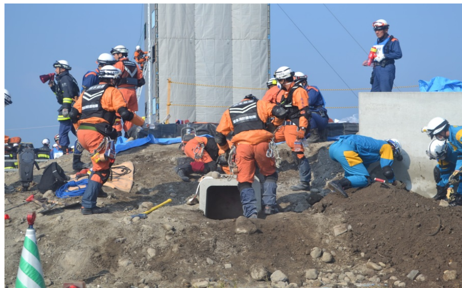
他機関(警察)との連携訓練