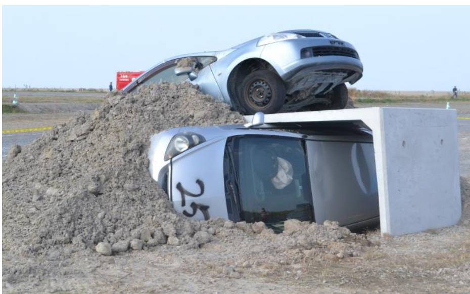
土砂埋没車両救出訓練