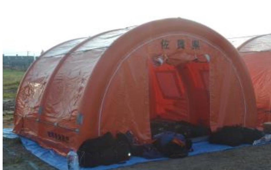
後方支援活動訓練