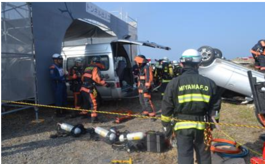
トンネル崩落傷病者救出訓練