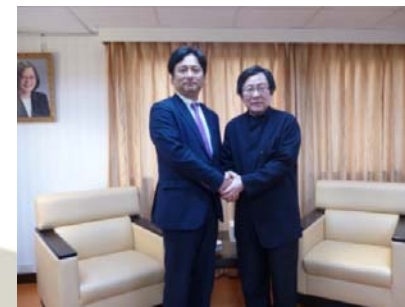
平成28年8月 台湾日本関係協会会長訪問時