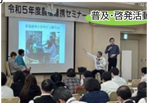
令和5年度版「ノウフク連携セミナー」普及・啓発活動

▼令和3年度「ノウフク連携プロジェクト推進チーム会議」を設置して、取り組みをスタート