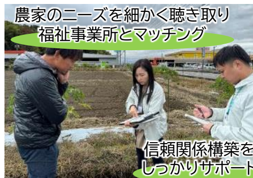
農家のニーズを細かく聴き取り 福祉事業所とマッチング