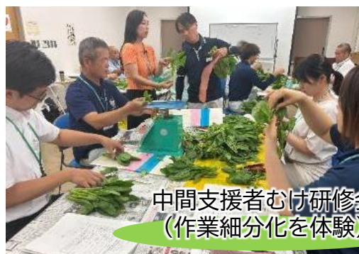
中間支援者むけ研修会 （作業細分化を体験）