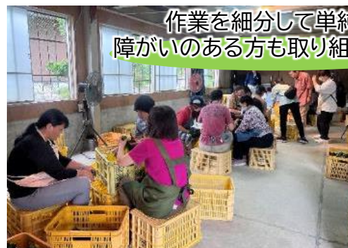
作業を細分して単純化 障がいのある方も取り組みやすく