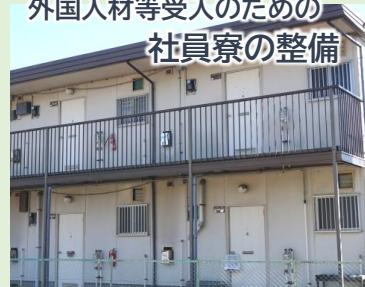
外国人材等受入のための 社員寮の整備