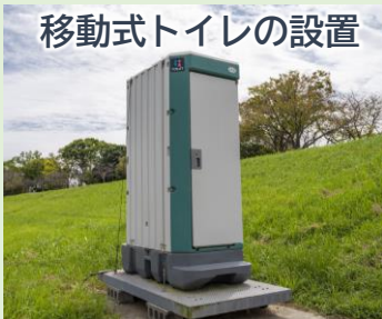
移動式トイレの設置