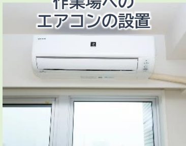
作業場への エアコンの設置