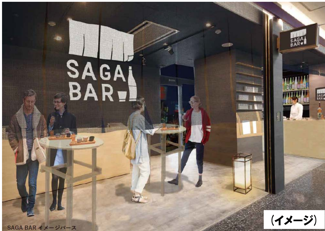
SAGA BAR イメージバース