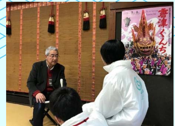
生徒による関係者への取材の様子