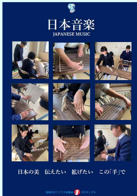
部門紹介パネル(全23部門)