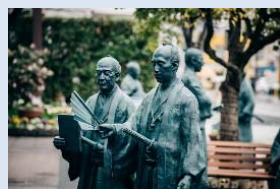
佐賀市中央大通り(25体)