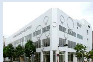
バルーンミュージアム