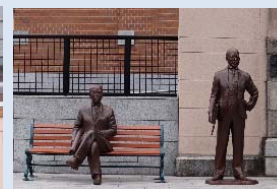
偉人のゆかりの地(11体)