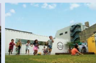
わいわい!! コンテナ2