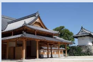
佐賀城本丸歴史館