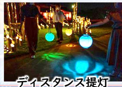
ディスタンス提灯