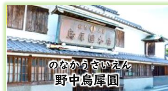
のなかうさいえん 野中烏犀園