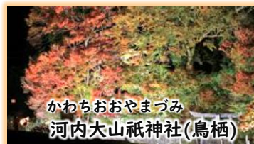
かわちおおやまづみ 河内大山祇神社(鳥栖)