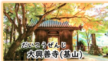
だいこうぜんじ 大興善寺(基山)