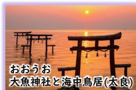
おおおう 大魚神社と海中鳥居(太良)