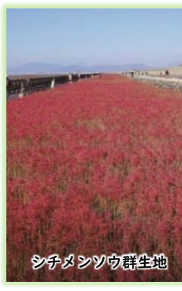
シチメンソウ群生地