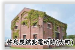
杵島炭鉱変電所跡(大町)