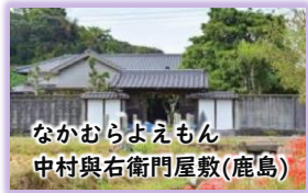
なかむらよえもん 中村右衛門屋敷(鹿島)