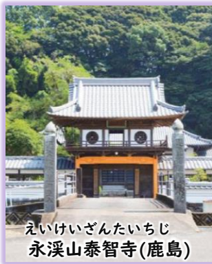
えいけいざんたいちじ 永溪山泰智寺(鹿島)