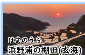
はまのうら 浜野浦の棚田(玄海)