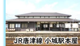
JR唐津線 小城駅本屋