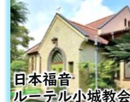
日本福音 ルーテル小城教会