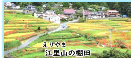
えりやま 江里山の棚田