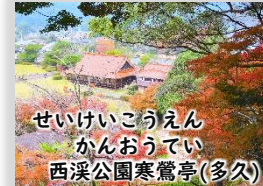
せいけいこうえん かんおうてい 西溪公園寒鶯亭(多久)