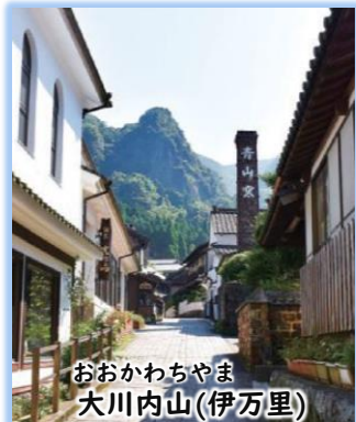
おおかわちやま 大川内山(伊万里)