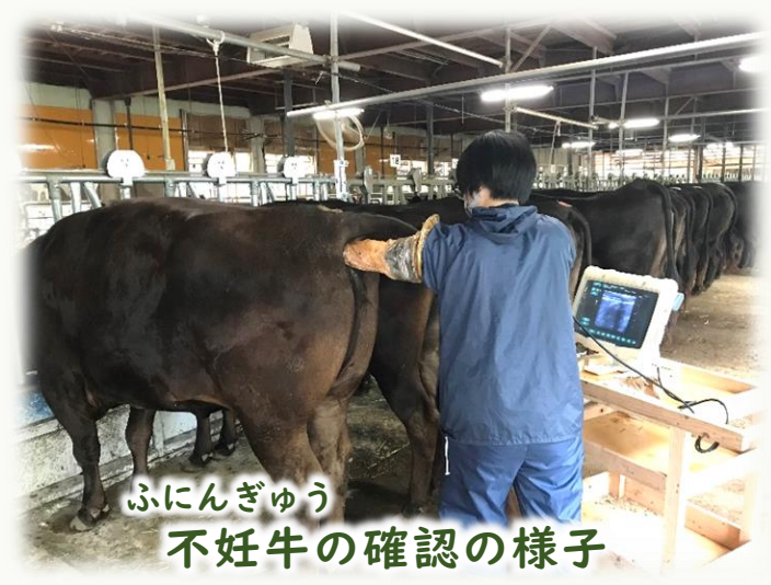
ふにんぎゅう 不妊牛の確認の様子