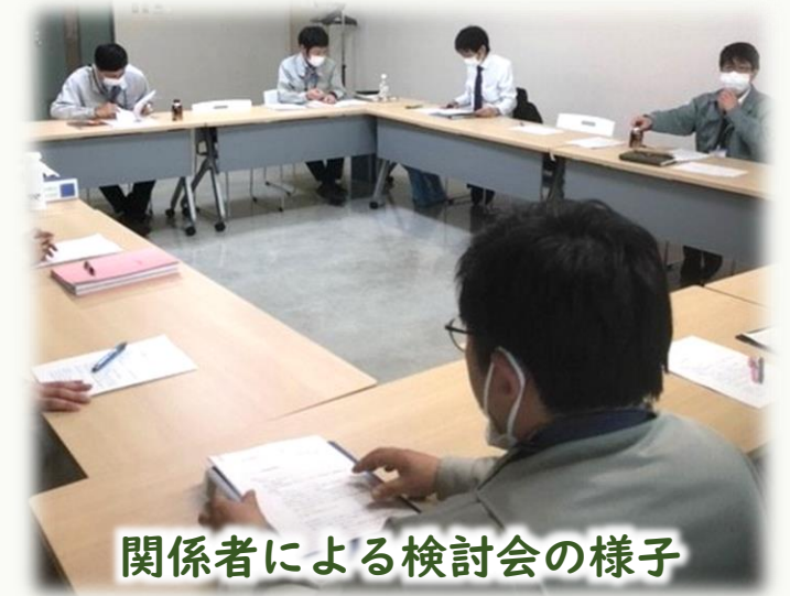
関係者による検討会の様子