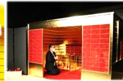
名護屋城 黄金の茶室(県立名護屋城博物館)