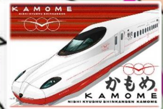
西九州新幹線かもめ 長崎