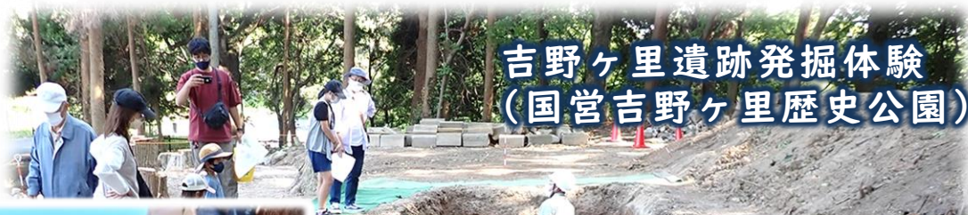
吉野ヶ里遺跡発掘体験 (国営吉野ヶ里歴史公園)