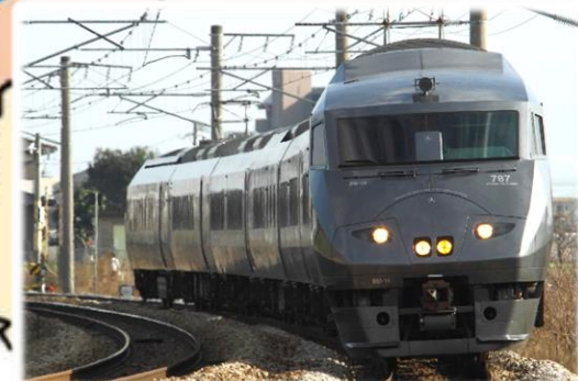
特急かささぎ 肥前鹿島 - 博多間