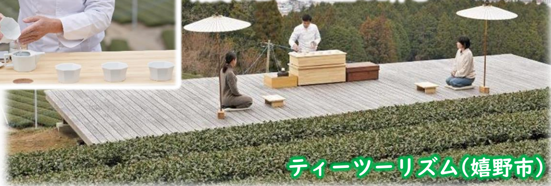
ティーツーリズム(嬉野市)