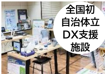
全国初 自治体立 DX支援 施設