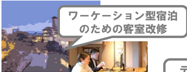
ワーケーション型宿泊 のための客室改修