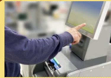
POSレジ導入による マーケティング戦略