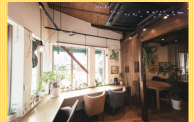
温泉旅館の一部を カフェに