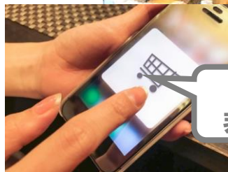
ECサイト活用で 非接触型販売の充実