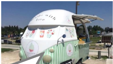
キッチンカー導入 による移動販売