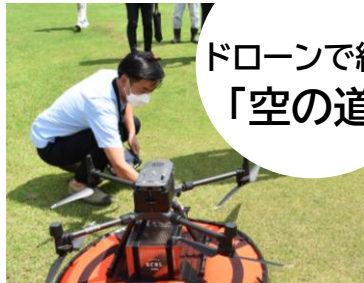
ドローンで結ぶ 「空の道」