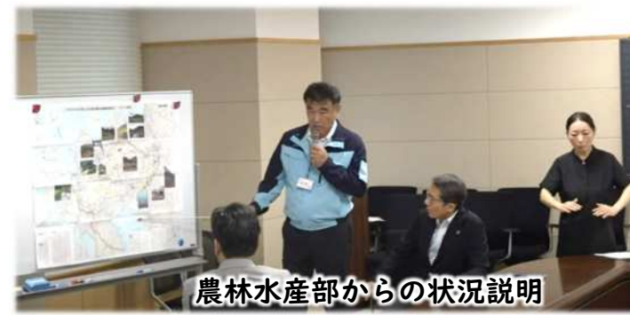
農林水産部からの状況説明