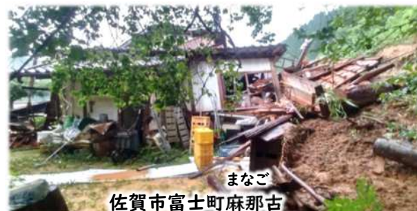
まなご 佐賀市富士町麻那古