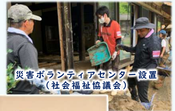
災害ボランティアセンター設置 (社会福祉協議会)