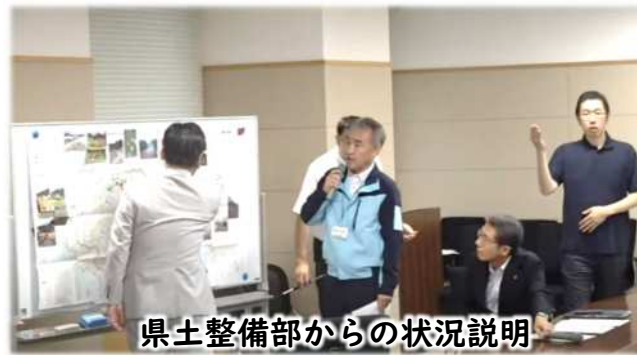
県土整備部からの状況説明