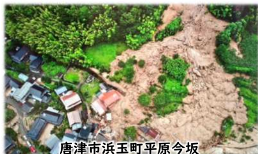
唐津市浜玉町平原今坂