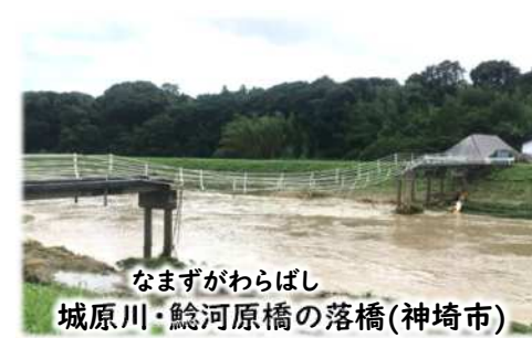
なますがわらばし 城原川・鯉河原橋の落橋(神崎市)