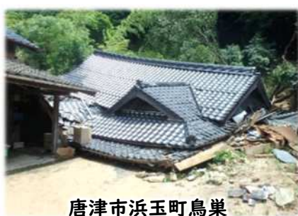
唐津市浜玉町鳥巢