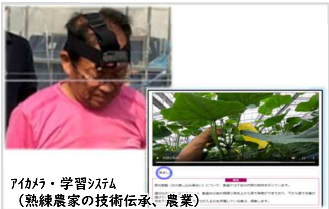
アカメラ・学習システム (熟練農家の技術伝承、農業)