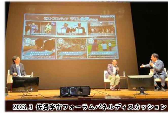
2023.3 佐賀宇宙フォーラムパネルディスカッション