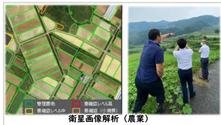
衛星画像解析 (農業)