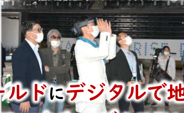
2022.10 MR(複合現実)実証 (SAGAアリーナもうすぐ完成内覧会)