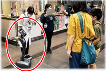
ロボット「Temi」総合代理店「hapi-robot」