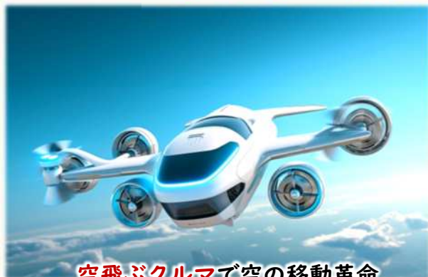
空飛ぶクルマで空の移動革命