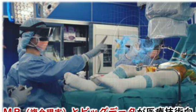
MR (複合現実) とビッグデータが医療技術向上