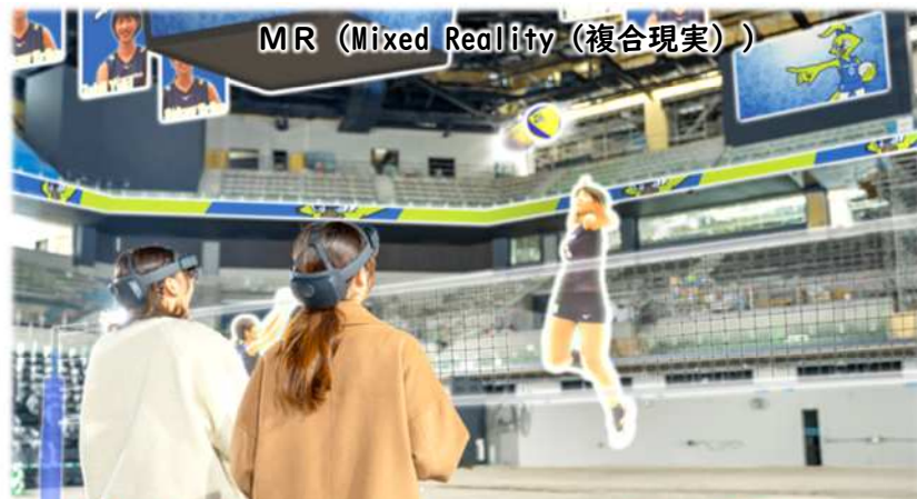
MR (Mixed Reality (複合現実))