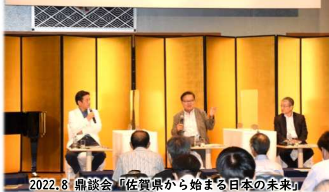
2022.8 鼎談会「佐賀県から始まる日本の未来」