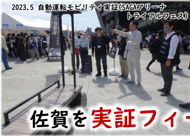
2023.5 自動運転モビリティ実証(SAGAアリーナ トライアルフェス)