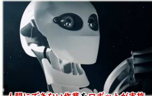
人間にできない作業をロボットが実施