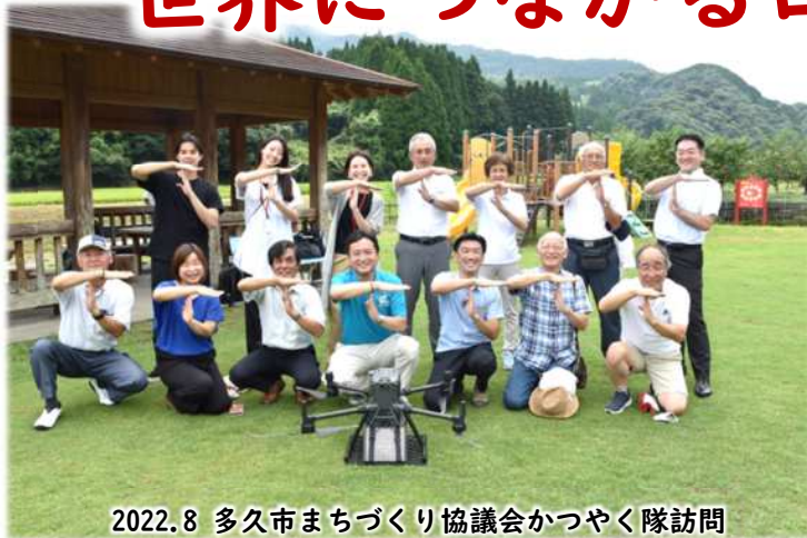
2022.8 多久市まちづくり協議会かつやく隊訪問