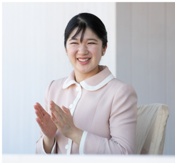
SAGAスタジアム 陸上競技御覧