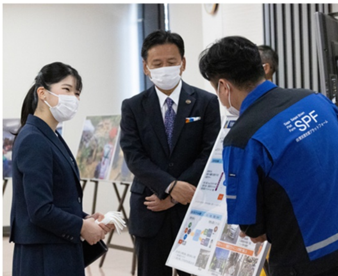
佐賀県赤十字血液センター 県とCSOとの連携による被災者支援の取組御聴取