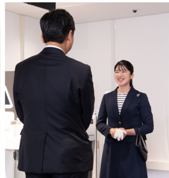
九州佐賀国際空港 御出発