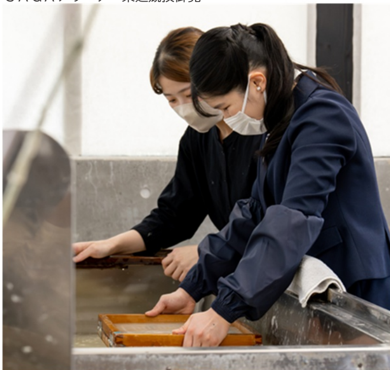
名尾手すき和紙 紙すき御体験