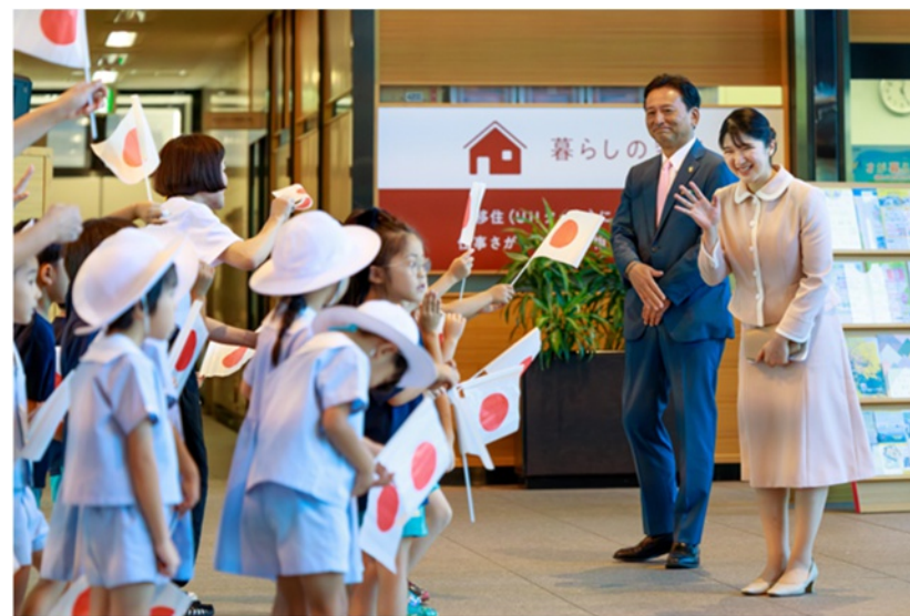
佐賀県庁 園児によるお出迎え