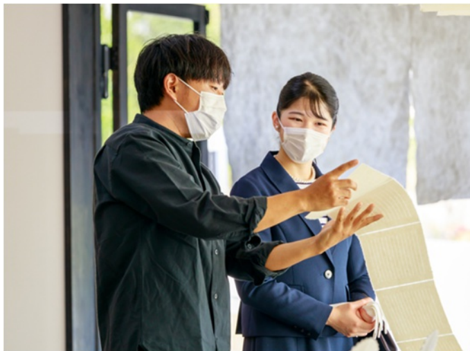
名尾手すき和紙 店舗「KAGOYA」御視察