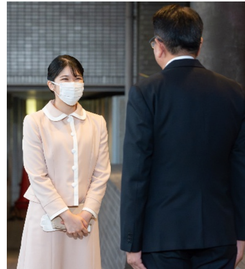
ホテルニューオータニ佐賀 御到着