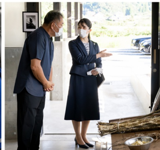
名尾手すき和紙 災害からの復興・和紙の制作行程御聴取