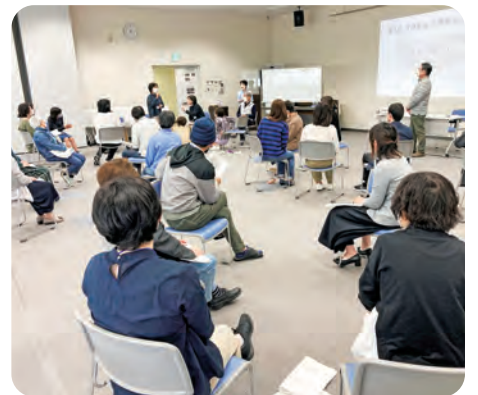
▲手話通訳研修会の様子(佐賀市)

これらのボランティアや競技補助員の方には、おもてなしの心をもって選手や来場者に接するよう研修等を行い、来県される全ての方を歓迎し、佐賀ファンとなって帰っていただけたらいいようにしっかりと取り組んでいきたい。