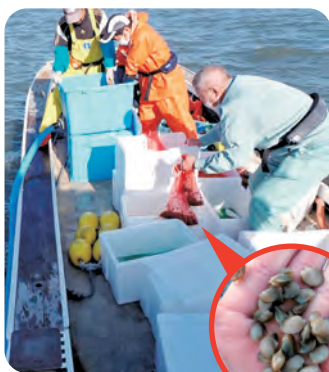
▲サルボウ人工稚貝の放流の様子 (有明海佐賀県西南部海域)

今後も漁業者、漁協、関係機関との連携をさらに強め、有明海の水産資源の回復に向けた取組みを粘り強く実施していく。