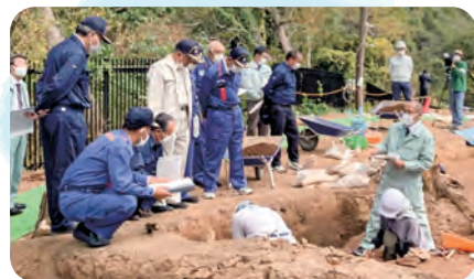
日吉神社境内地跡 (吉野ヶ里遺跡発掘調査の状況)