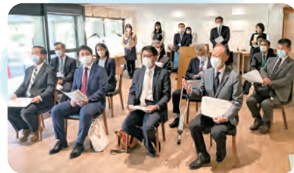
県立図書館（「みんなの森」整備の状況） ※「森」の字は、3つの「本」で構成した創作漢字です。