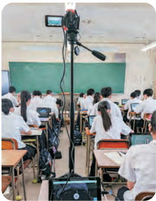
▲授業を教室外に配信する様子 (県立高校)

県立学校における不登校の生徒へのICTを活用した支援として、校内の別室に登校した生徒に向けたオンライン授業を実施している。 また、担任又は関係者とのオンラインによる連絡や課題のやり取り、面接などICTの良さを生かした取り組みを行っている。一方で、不登校の生徒へのオンライン授業については、本人の意思や保護者との連絡、協力体制などが保たれていることや不登校が長期にわたることがないように配慮する必要があると考える。 今後不登校の児童生徒が社会的な自立や円滑な学校への復帰を目指す支援策の一つとしてICTを積極的に活用していきたい。