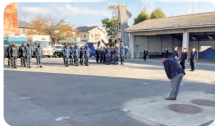
警察本部 警備部 機動隊 (機動隊の活動・訓練状況)