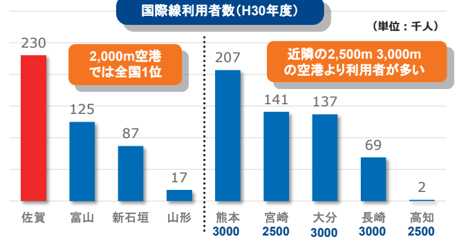
▲H30年度(コロナ前)の国際線利用者数は、2,000m滑走路の空港としては全国1位。近隣の2,500m空港や3,000m空港と比べても多い。