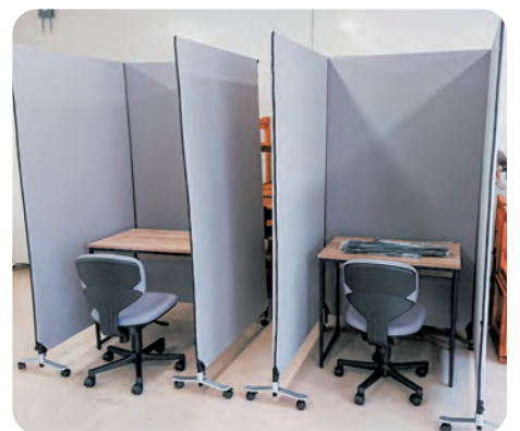
▲別室に設置したオンラインブース (県立高校)