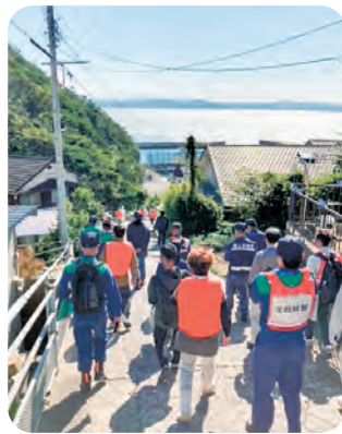
▲原子力防災訓練の様子(松島屋内退避からの移動)

また、避難先となっている地域に対しては避難元市町を通じて周知を図っているものの、関係市町の広報紙に具体的な訓練内容を記載したり、実際に訓練で使用する施設近隣の自治会の回覧等で周知したりするなど、関係自治体と協力し、一層の周知に努めていきたい。