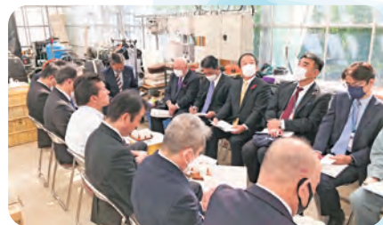
園芸ハウス団地（園芸ハウス団地の概要と トレーニングファーム卒業生の状況）