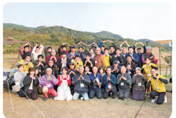
▲「山の会議(仮)」吉野ヶ里・上峰・みやきブロック開催の様子

離島、中山間、双方地域の県境が様々な役割を果たしている中で、県は地域の課題に向き合い、平成28年5月に「佐賀県中山間地・離島・県境振興対策本部」を立ち上げているが、これまでどのような取組みを行ったのか。また、今後もこのような地域の振興に向けて、どのように取り組んでいくのか。