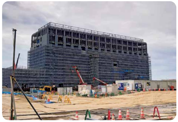
佐賀駐屯地（仮称）整備の様子（佐賀市）