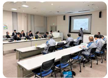
玄海原子力発電所 (緊急時対策棟について)