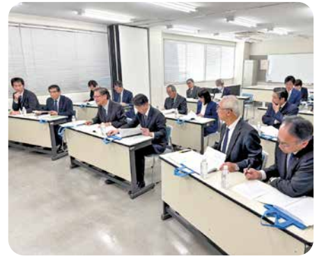
九州国際情報ビジネス専門学校 (専修学校の運営状況等について)

「九州国際情報ビジネス専門学校、九州国際高等学園」及び「産業技術学院」を訪問し、運営状況等についての説明を受け、質疑や意見交換、授業見学を行いました。