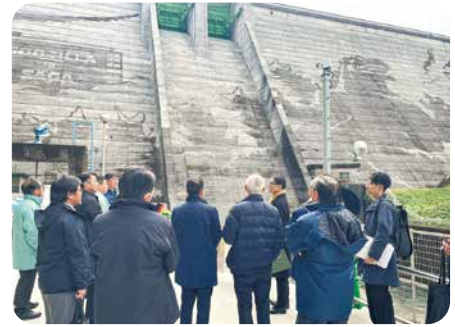
岩屋川内ダム (サガプライズ!「ゴジラ対(ついでに)サガ」の概要について)