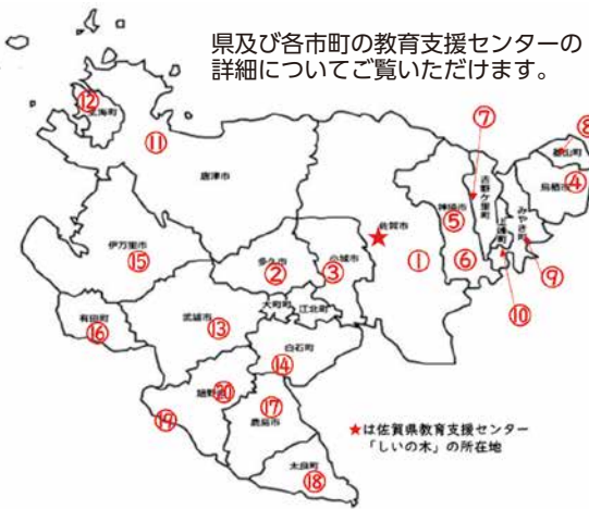
県及び各市町の教育支援センターの詳細についてご覧いただけます。

きれば外部に通う場合でも学校とつながってほしい、学校でなくても教育支援センターや訪問支援など、児童生徒にとって安心できるところにつながってほしいと願っている。今後とも、児童生徒が一人一人の状況に応じた支援を受けられることができるよう、市町と連携しながら引き続き充実を図っていく。