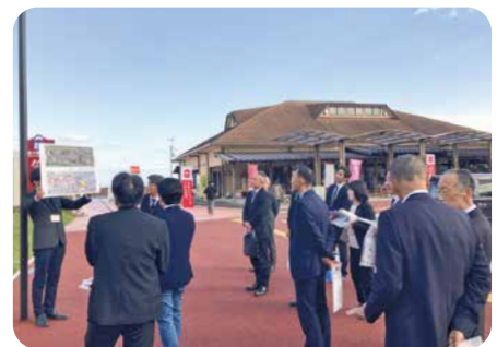
道の駅 鹿島 (再整備の状況について)