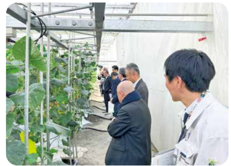
低コスト耐候性ハウス（きゅうり） (統合環境制御技術による農業経営の展開について)