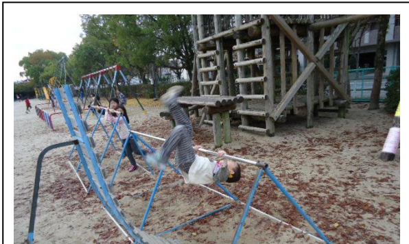
【トレーニングの様子・逆上がり】