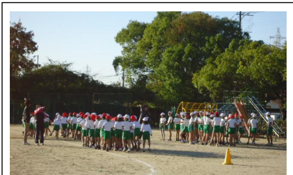
【マラソンタイム・準備】 健康観察後、準備運動を行う