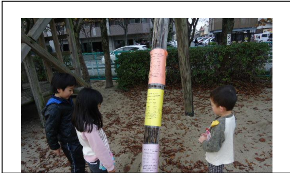
【トレーニングの様子・トリム】 運動メニューを示したカードを遊具に掲示する