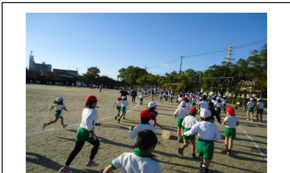
【マラソンタイム】 低中高学年が3コースに分かれて走る