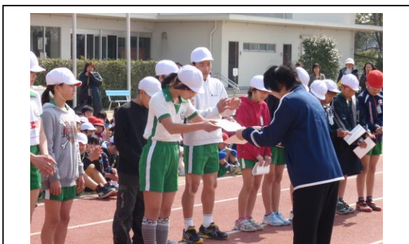
【マラソン大会 (H24)】 表彰式、入賞おめでとう。