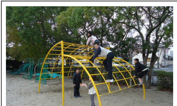
【トレーニングの様子・うんてい】