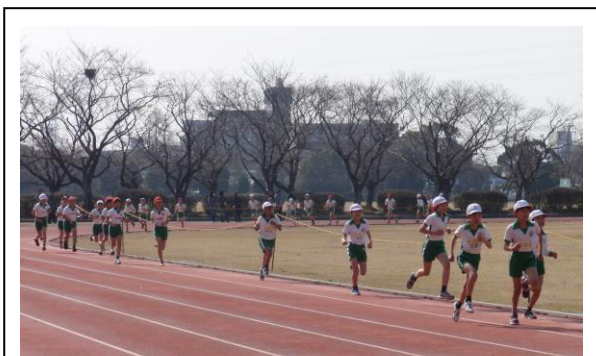
【マラソン大会 (H24)】 競技場で走るのは気持ちいいです!