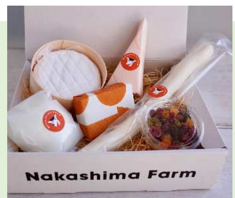
加工品のチーズ等

新規就農者への応援活動は、農業士会でも議論しながら実施しています。農業の現場を理解して就農してもらえたらと食と命の教育に取り組んでいます。