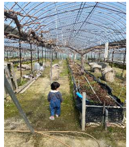
ブドウハウスの様子

その頃は巨峰だけでした。その後、ぶどう園を改植して根域制限に変え、巨峰に加えシャインマスカットやピオーネ、クイーンニーナなどを作るようになりました。