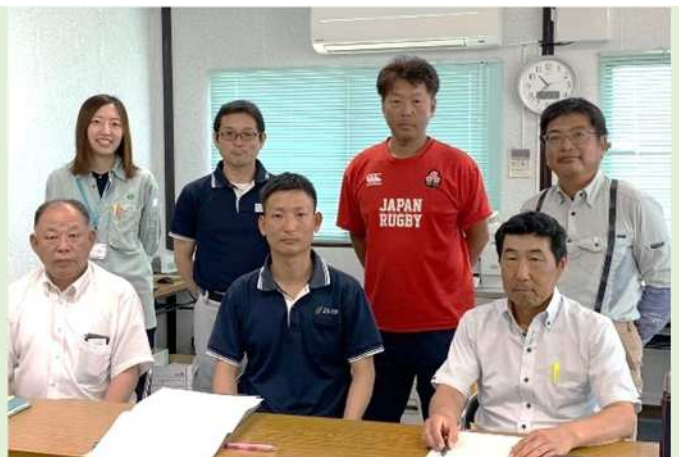
トマトトレファの講師陣