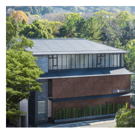
▲茶色の外観が目印