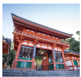
▲近くには八坂神社も