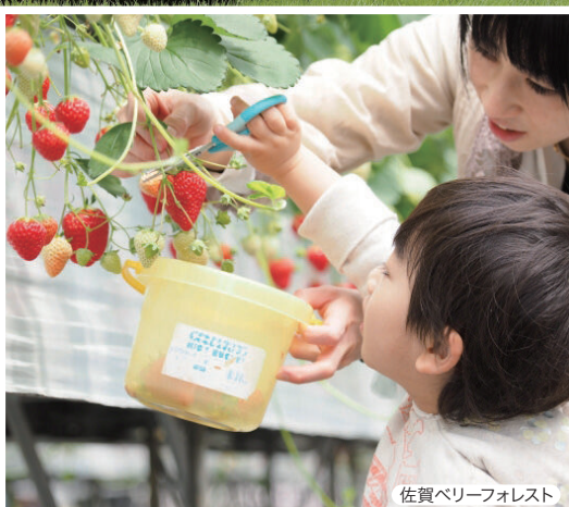
佐賀ベリーフォレスト