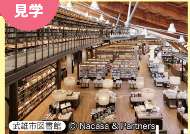
武雄市図書館