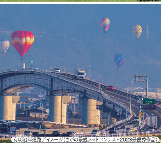
有明沿岸道路/イメージ(さがの景観フォトコンテスト2023最優秀作品)