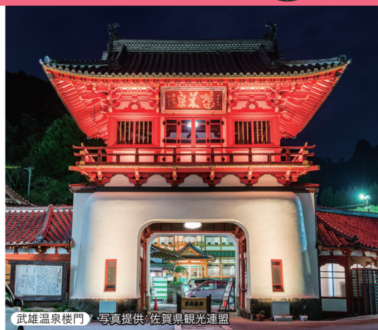
武雄温泉楼門