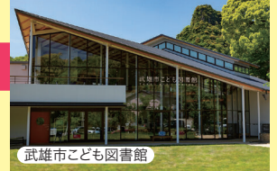
武雄市こども図書館