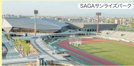
SAGAサンライズパーク

SAGA2024国スポ・全障スポの開会式で実際に 使用するSAGAサンライズパークを見学!