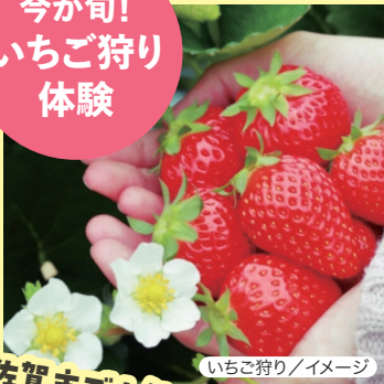
いちご狩り/イメージ