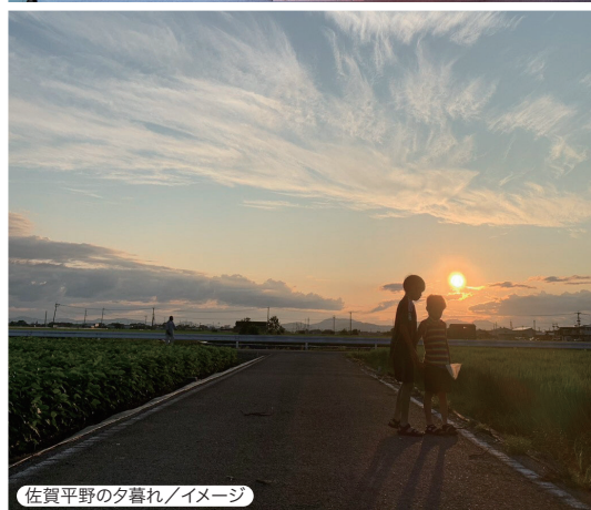
佐賀平野の夕暮れ/イメージ