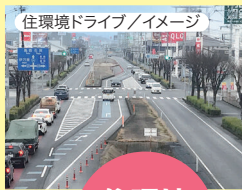
住環境ドライブ/イメージ