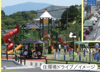
住環境ドライブ/イメージ