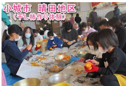
田植え、稲刈り体験、生き物調査、芋さし、芋ほり、干し柿づくり体験等