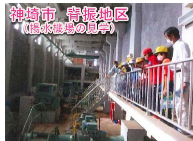
花、野菜の植栽体験、水生生物調査、揚水機場及び頭首工の見学等