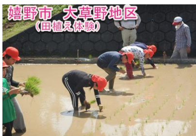
稲作体験、芋ほり、蛍の幼虫放流、大草野の水と農業の歴史講和等