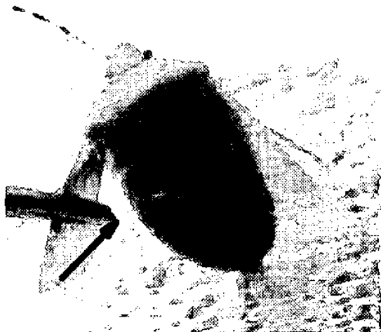
図4 ミナミアオカメムシの腹部背面(矢印の部分も緑色である)