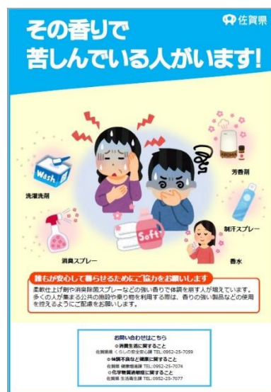
▲香りに関する周知啓発ポスター