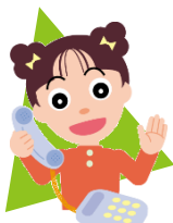
たまされないちゃん

SNSの広告を見て「お試し」のつもりでダイエットサプリを注文した。1回限りと思っていたが、翌月2回目が届き、請求金額が高額になった。解約したいがコールセンターに電話が繋がらない。