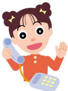
だまされないちゃん

トラブルになった時は、 消費生活センター や 消費者ホットライン「188」 などへ相談しましょう。