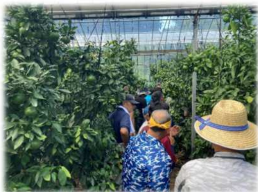
「にじゅうまる」栽培研修

露地カンキツでは、高品質かつ省力化につながる栽培方法としてS.マルチ栽培の推進を行っています。