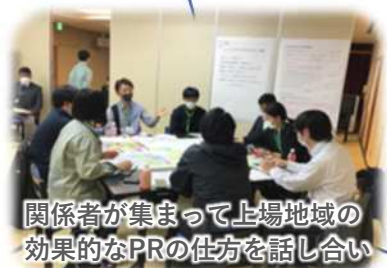
関係者が集まって上場地域の 効果的なPRの仕方を話し合い

SAGA UWABA 佐賀上場ファームうまかもん半島 -世界とつながり、エコで健康な農業であ〜る-