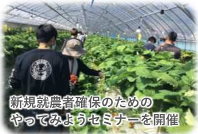
新規就農者確保のための やってみようセミナーを開催