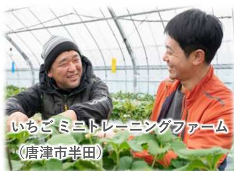
いちごミニトレーニングファーム (唐津市半田)

いちごやアスパラガス、きゅうりなどのミニトレーニングファームを中心として、園芸団地の整備を推進します。