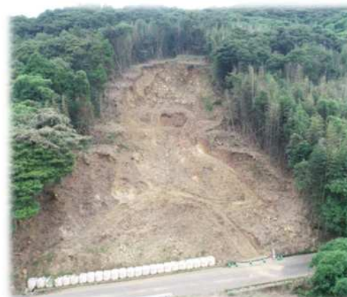
令和3年8月14日の集中豪雨により被災 (唐津市 湊町 清水地区)

山地災害の未然防止と災害が発生した場合の早期復旧を図るため、荒廃地に治山ダム等の溪間工事や土留工・植栽等の山腹工事を行っています。