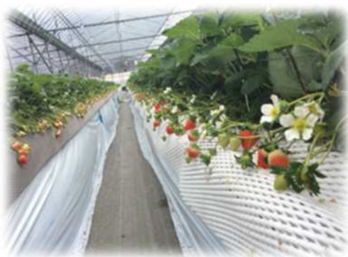
イチゴハウスの様子