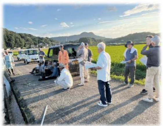
逢地さがびより栽培研修会

イノシシによる農作物被害が深刻化している現状を受け、鳥獣害防止対策のビジョン作成や箱わな研修を実施しています。あわせて、ワイヤーメッシュ柵の維持点検や農地周辺の潜み場の除去など基本的な対策を行っています。