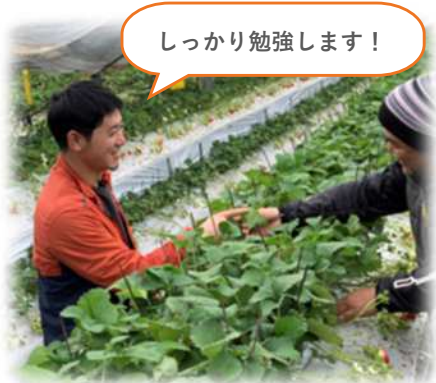
唐津・玄海版アグリ・トレーニングによる圃場研修