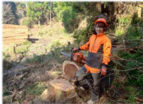
管内の森林組合で活躍する「さが林業アカデミー」修了生