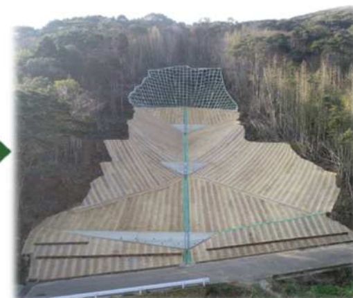
災害関連緊急治山事業により 工事完了 (山腹工事)