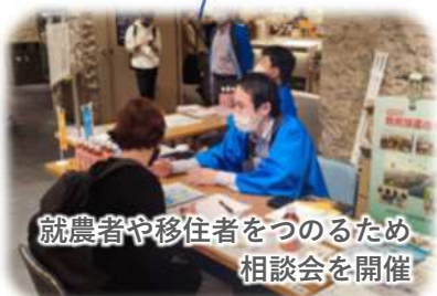
就農者や移住者をつのるため 相談会を開催