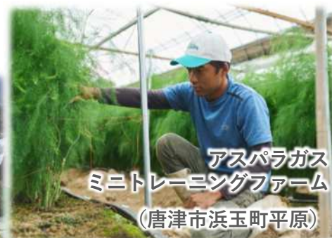
アスパラガス ミニトレーニングファーム (唐津市浜玉町平原)