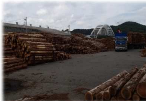
土場からトラックに積み込み 市場まで運搬します