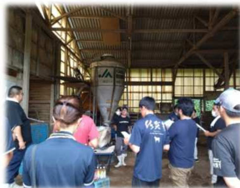
青年部対象の牛舎環境についての意見交換会

また、地域内のトレーニングファーム（佐賀牛いろはファーム）を活用し将来の産地を担う新規就農者の育成にも力を入れていきます。