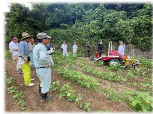
黒大豆「佐賀黒7号」中耕培土機実演会