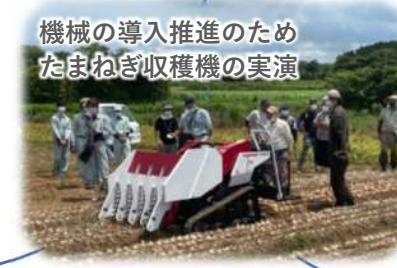
機械の導入推進のため たまねぎ収穫機の実演