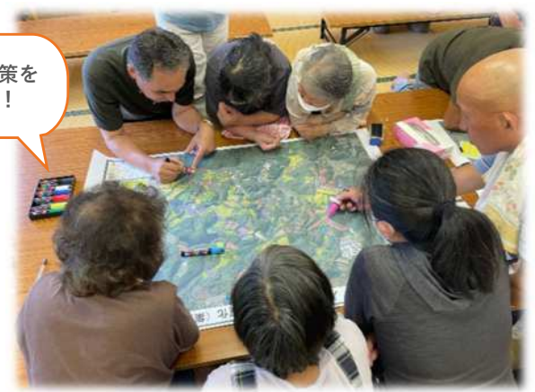
八床地区鳥獣害マップ作り