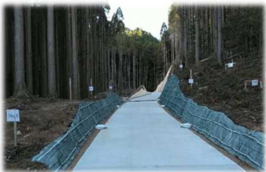
あせび線 (唐津市巖木町) ※開設中