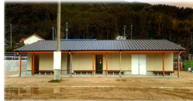
鏡山小学校 屋外倉庫（木造）

県産木材を活用した公共施設や、家具や内装等への活用など、多様な木材利用を進めています。