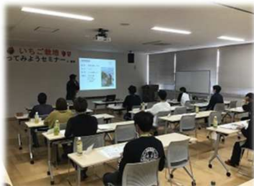
いちご栽培やってみようセミナーの様子