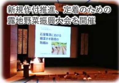
新規作付推進、定着のための 露地野菜振興大会を開催