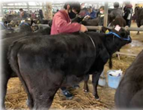
牛の体側をしている様子