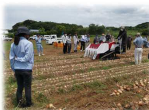
タマネギの茎葉処理・掘り取り機の実演