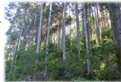
地表に植生が回復した森林へ再生

「森林環境税」を財源に手入れが遅れたスギ・ヒノキの人工林において間伐等を行い、下層植生の回復や針葉樹と広葉樹が混じり合った森林づくりを進めています。