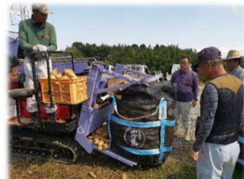
加工用カンショのフレコン収穫作業の様子