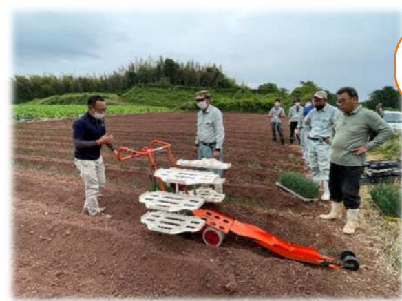
石室集落根深ネギ機械定植実演会