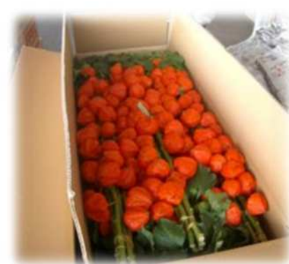
ホオズキ出荷の様子