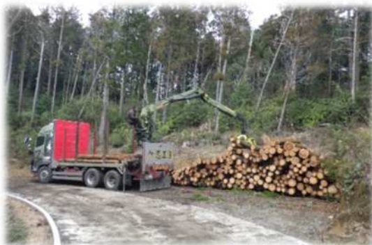
三方線 (唐津市相知町)