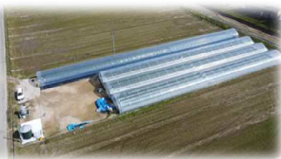
令和5年度に新たに整備されたイチゴミニトレーニングファーム