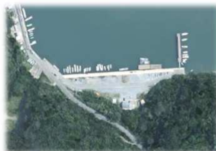
耐震補強箇所の全景

県内唯一の防災拠点漁港（佐賀県地域防災計画における緊急物資の輸送基地）である名護屋漁港において、防災基地となっている耐震強化岸壁及び背後用地等の耐震・耐津波診断に基づき、対策事業を実施します。