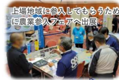
上場地域に参入してもらうため に農業参入フェアへ出展