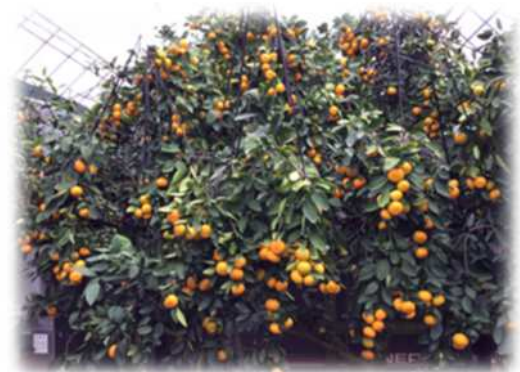
ハウスミカンが実っている様子