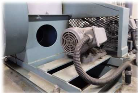
脱臭プロアの更新 相賀地区（唐津市）