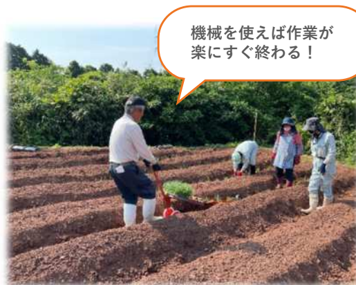
根深ネギの定植作業の省力化