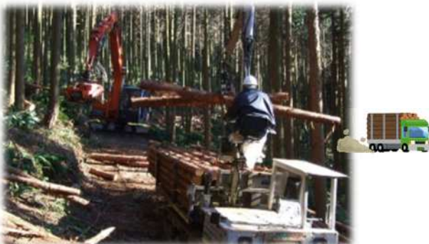
土場まで木材を運搬集積