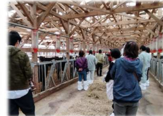
優良事例視察研修