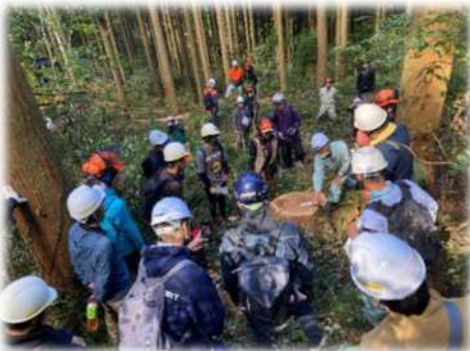
林業体験会（管内森林組合現場）