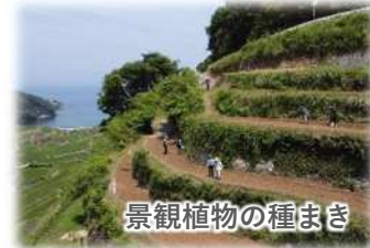
景観植物の種まき