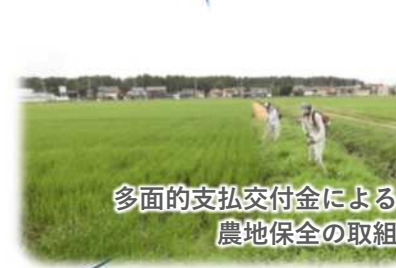
多面的支払交付金による 農地保全の取組