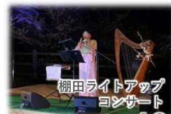
棚田ライトアップ コンサート

棚田地域振興法に基づき地域指定された棚田地域を対象に、農地や水路等の保全活動や都市住民も交えた地域住民の活動等を支援します。