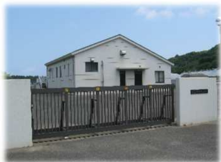
農業集落排水処理場 相賀地区（唐津市）

農村地域における生活排水やし尿を処理する施設を整備し、農業用水の水質保全と併せて農村生活環境の改善を図ります。また、処理人口の増加、老朽化に対応するため、既存施設の機能強化、更新を実施します。