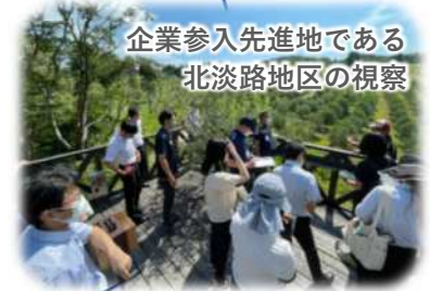
企業参入先進地である 北淡路地区の視察