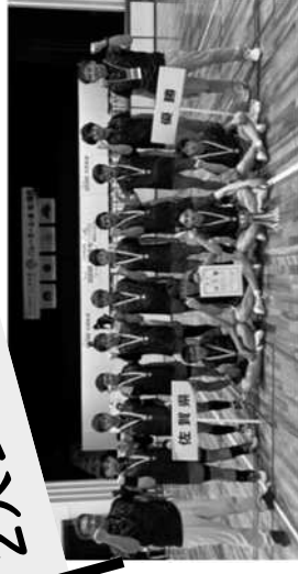
バレーボール (知的・男子)