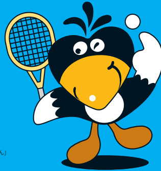
マスコットキャラクター「かっちゃん」