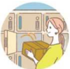
ご自宅の宅配ボックス・置き配 ※ご自宅の敷地内に限る