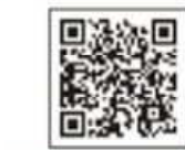
クロネコメンバーズ登録