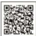
スマートクラブ登録