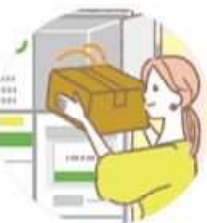
PUDOなどの宅急便ロッカー