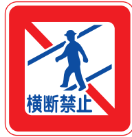
歩行者 横断禁止の標識