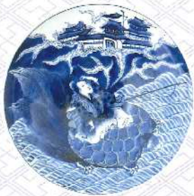
染付浦島太郎文大皿 肥前有田 1800~1840年代