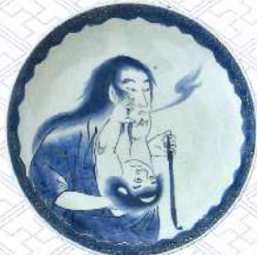
染付山姥金太郎文大皿 肥前有田 1800~1840年代