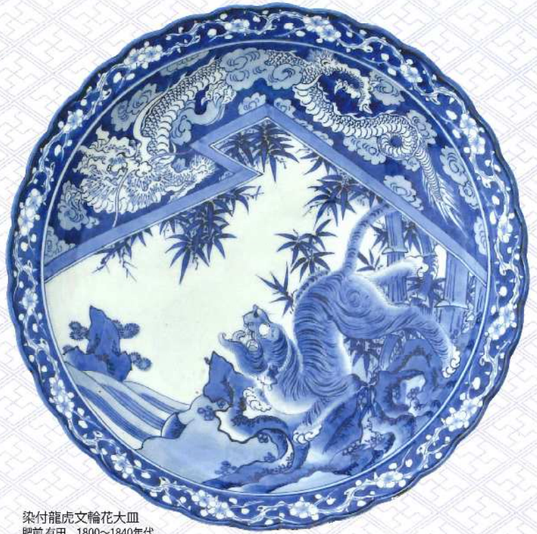
染付龍虎文輪花大皿 肥前有田 1800~1840年代

時代を反映する浮世絵や人気の画題が描かれた有田の大皿の美とともに、江戸大皿の百物語の世界をご堪能ください。(出品点数120点)