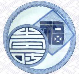
染付福寿字文大皿 肥前有田 1800~1840年代