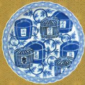
染付酒樽文輪花大皿 肥前有田 1820~1860年代