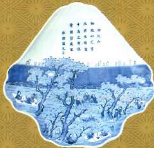
染付御殿山花見文富士山形大皿 肥前有田 1800~1860年代