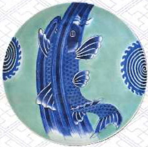
青磁染付登龍門文大皿 肥前有田 1820~1860年代