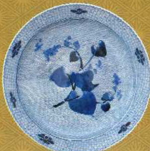
染付波秋海棠文輪花大皿 肥前有田 1800~1840年代