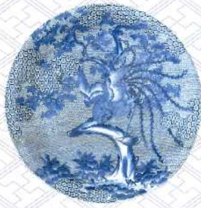
染付桐鳳凰文大皿 肥前有田 1820~1860年代