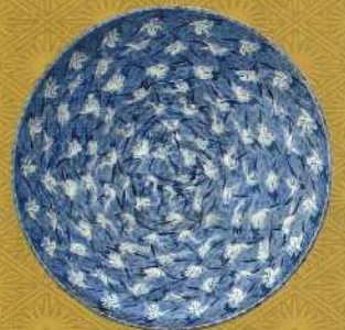
染付鶴文大皿 肥前有田 1800~1840年代