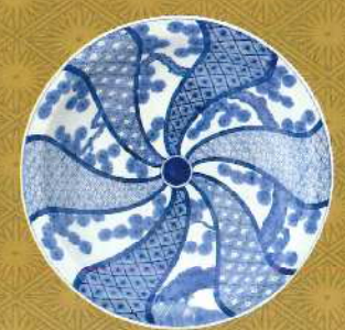
染付松樹捻花文大皿 肥前有田 1780~1800年代