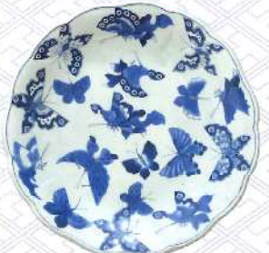
染付蝶文輪花大皿 肥前有田 1800~1840年代