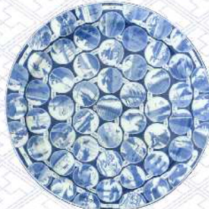
染付東海道五十三次文大皿 肥前有田 1820~1860年代