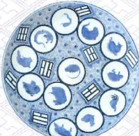
染付十二支八掛文大皿 肥前有田 1780~1820年代