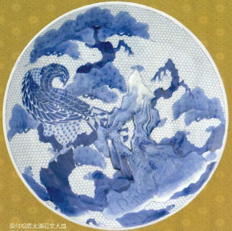
染付松鷹太湖石文大皿 肥前有田 1790~1830年代

時代を反映する浮世絵や人気の画題が描かれた有田の大皿の美とともに、江戸大皿の百物語の世界をご堪能ください。(出品点数120点)