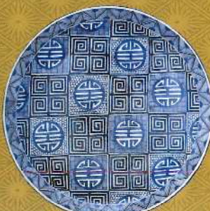
染付寿字雷文大皿 肥前有田 1800~1840年代