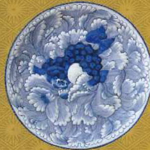
染付獅子牡丹文輪花大皿 肥前有田 1820~1860年代