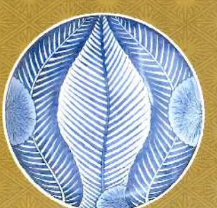
染付葉文大皿 肥前有田 1820~1860年代