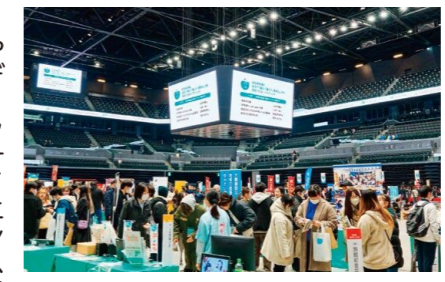
学生と県内企業等との交流会の様子

近年、県内の有効求人倍率は高い水準で推移しており、多くの企業から人材不足に悩んでいるとの声が上がっています。そこで、県内の企業で働く人を増やすため、高校生や保護者向けの県内企業合同説明会や、教員や大学生を対象とした県内企業との交流会を開催しています。また、県内出身者の多い東京・大阪・福岡でのイベントや県内企業とのオンライン交流会の開催等、様々な取り組みを行っています。