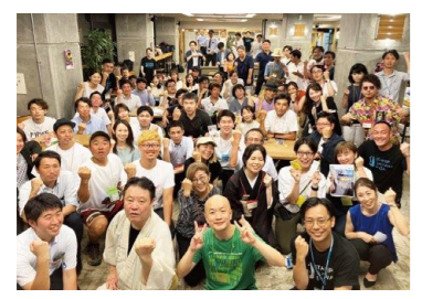
スタートアップ企業や支援者等の交流イベント

今年度はこれまでの支援に加え、さらに磨きかけた「起業家のフェーズに応じた8つの個別指導プログラム」や美と健康に関する分野に特化した新規事業にチャレンジする県内企業と県内外のスタートアップ企業との協業支援等を行っています。