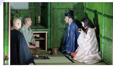
大茶会での草庵茶室お披露目

「名護屋城跡並びに陣跡」は、約400年前、豊臣秀吉や徳川家康など、全国から150を超える武将オールスターが集結した城郭の遺跡群です。人口20万人を超える世界最大規模の大都市が出現し、茶の湯や能による文化交流が行われ、伝統文化発展の「はじまりの地」となりました。そこで、「はじまりの名護屋城。」をコンセプトに様々な取り組みを進めており、今年度は第4回名護屋城大茶会のほか、名護屋城博物館常設展示のリニューアル、復元した「黄金の茶室」「草庵茶室」での体験プログラム、城跡・陣跡への周遊イベントの実施等により、さらなる文化ツーリズムの拠点を目指します。