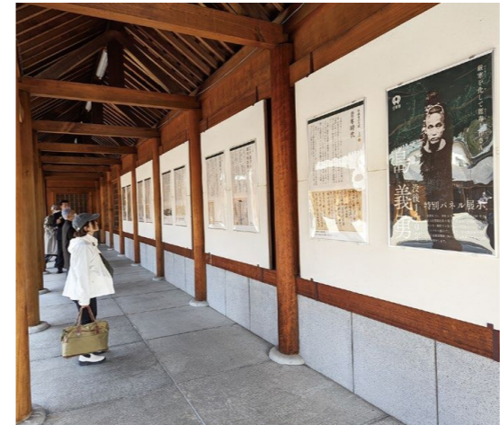
北海道神宮でのパネル展示の様子