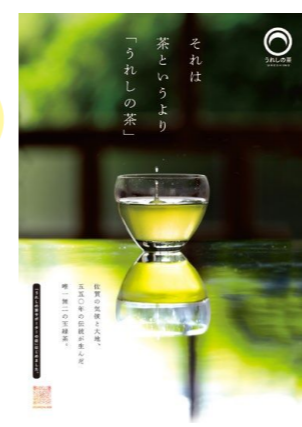
うれしの茶FAN拡大プロジェクトPRポスター

今年度は、試飲販売会やSNSキャンペーン等を通じて、お茶になじみのない若い世代も含めた多くの方に魅力が伝わるよう取り組みます。