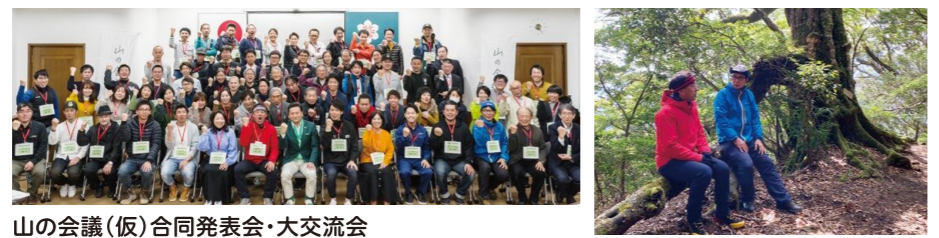
山の会議(仮) 合同発表会・大交流会

多様な人が集い、山を大切に想い、その未来を考える「山の会議(仮)」をきっかけに、未来へつながる「自発の地域づくり」の輪が広がります。進化することで山の地域がより光り輝くことを目指しています。