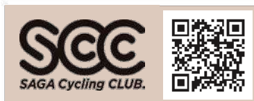
佐賀サイクリングクラブ SCC 公式 SNS