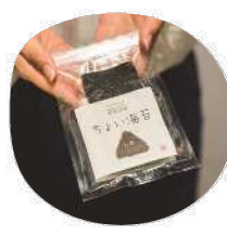
三福海苔 ちよい海苔 1袋