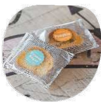
ラスク 2個 (数種類から好きなもの)