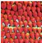
大賞 Fruits Garden 新 SUN 「佐賀県産 フルーツの盛り合わせ」