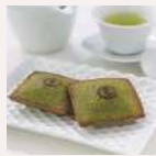
副賞 吉田屋 「ウレシカ嬉菓 フィナンシェ (5個入り)」