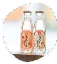
湯あがり堂 サイダー 2本 (3種から選ぶ)