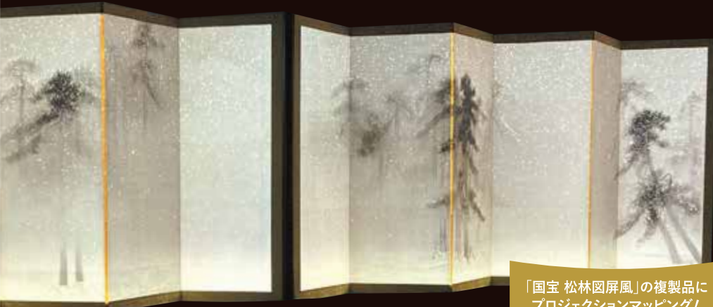
「国宝 松林図屏風」の複製品に プロジェクションマッピング!

高精細複製品 松林図屏風(プロジェクションマッピング) 原本: 国宝 長谷川等伯筆 安土桃山時代・16世紀 東京国立博物館蔵 高精細複製品制作: 文化財活用センター、キャンソ株式会社