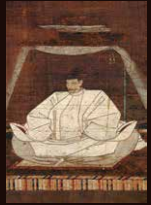
豊臣秀吉画像 佐賀県重要文化財 佐賀県立名護屋城博物館蔵

一部作品は展示替えがあります 作品の展示スケジュールや関連イベントの詳細は展覧会HPをご参照ください