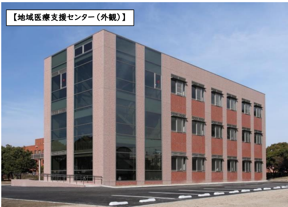
【地域医療支援センター（外観）】