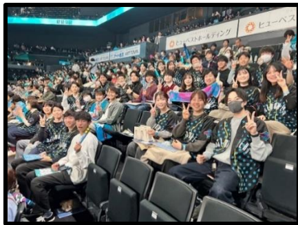
第1部：観客席での観戦