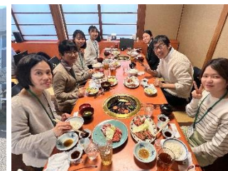
【西部医療圏等バスツアーの様子】