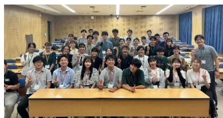
【夏期地域医療実習の様子】