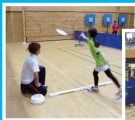
◀フライングディスク

障害福祉サービス事業所等による販売会 カレー、パン、焼き菓子、コーヒー、雑貨などを販売します。(約10店舗から出店)