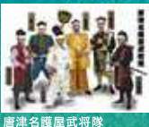
安芸ひろしま武将隊 唐津名護屋武将隊