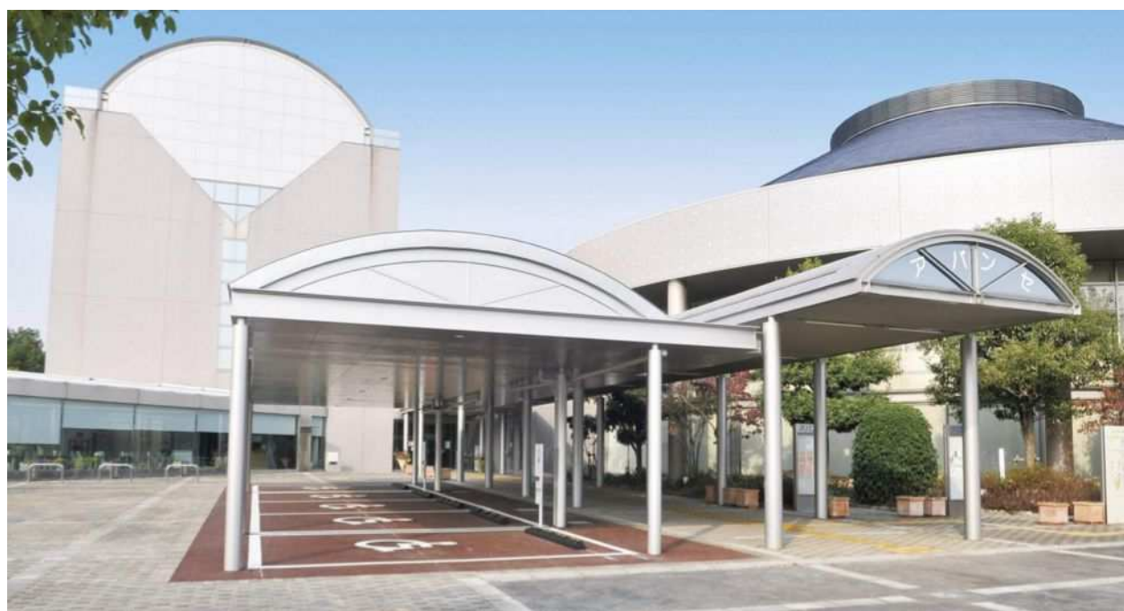
佐賀県立男女共同参画センター・佐賀県立生涯学習センター