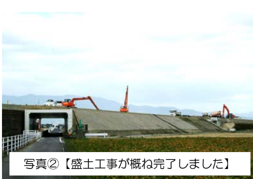
写真②【盛土工事が概ね完了しました】