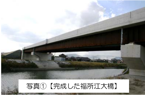
写真①【完成した福所江大橋】

【その他の工事】芦刈インターチェンジにおいて橋梁工事を実施しています（写真③）。この橋梁は、供用開始を予定している区間外ですが、供用開始後に工事をを行うと芦刈インターチェンジのランプを通行止めする必要があり、これを回避するために現在工事を進めています。