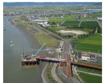
六角川大橋の橋脚工事状況