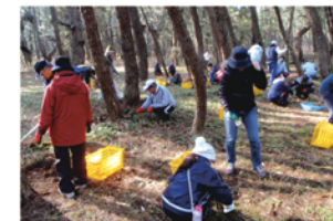
虹の松原の再生・保全活動