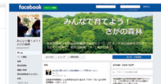
ホームページでの情報提供