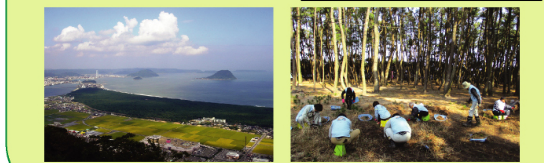
虹の松原の再生・保全活動